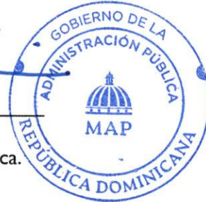
Darío Castillo Lugo Ministro de Administración Pública.

Resolución núm. 436-2023, que establece lineamientos para un Programa de Compensación por el Uso de Vehículos Propios, para funcionarios que ocupen cargos de alto nivel y otras categorías de cargos